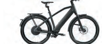
Sport, Suspension Fork & Suspension Seatpost Kinect